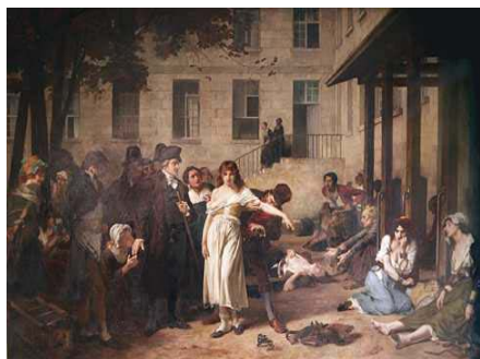
Bicetre Pinel en Pussin 1797